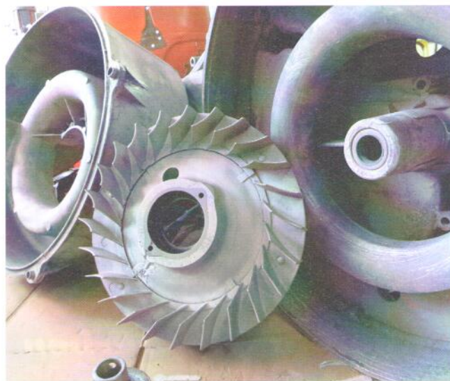
Nach der Reinigung ist vor dem Spritzen.