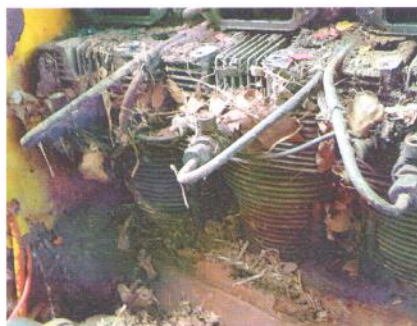
Was verbirgt sich unter dem Laub...

Aber jetzt nicht zurück, sondern nach heute und morgen schauen. In der Zwischenzeit wurden die zweieinhalb Tonnen Metall mit Schwerpunkt Rost und Spuren der Farben Gelb, Orange, Blau und Rot in ihre Einzelteile zerlegt. Abbeizen, Sandstrahlen, Ultraschall, aber vor allem mit viel Handarbeit erfolgten die Reinigungs- und Instandstellungsarbeiten. Lager und Dichtungen ersetzen für einen zuverlässigen Einsatz ohne Ölverluste.