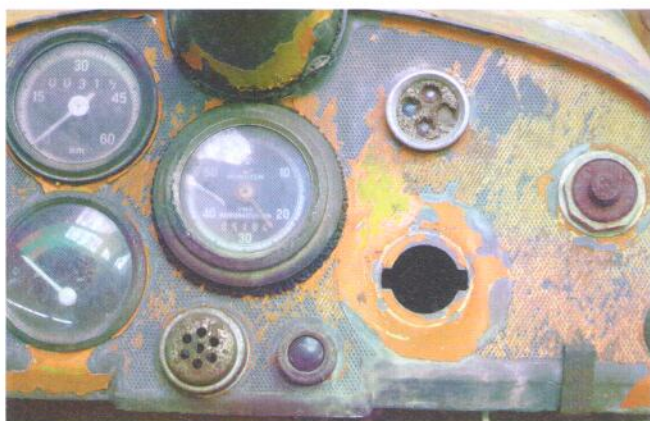
Cockpit ohne GPS.