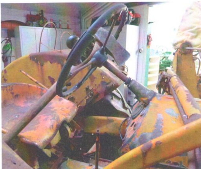
Start zum grossen Abenteuer.

Dass es so lange dauert war nicht vorgesehen. Der erste Bericht in der Ausgabe 2/2014 liegt immerhin runde fünf Jahre zurück. So hat der Start ausgesehen: https://budefaescht.ch/start/alte-landtechnik – Aber jetzt nicht zurück, sondern nach heute und morgen schauen.