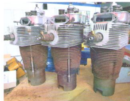
...es sind die drei Zylinder.

Jetzt geht es an den Aufbau des Traktors. Die Sanierung der Anbaugeräte wie Frontschaufel und Heckbagger folgen. Die Hydraulik und deren Steuerung wird noch interessante Fragen aufwerfen. Auch die Elektrik will neu aufgebaut sein. Zielsetzung: ein «neuer» Traktor soll bald betriebsbereit sein. Das Ergebnis wird in der «alteLandtechnik» vorgestellt.